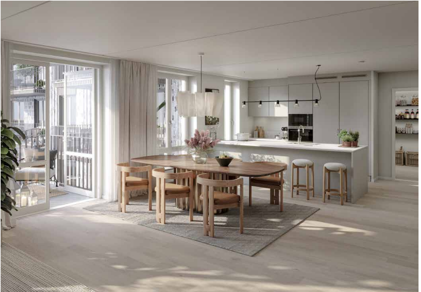
Inredningen består av stilrena och smarta materialval där form och funktion får samspela; från tåliga trägolv till elegant stenkomposit på kökets arbetsytor.