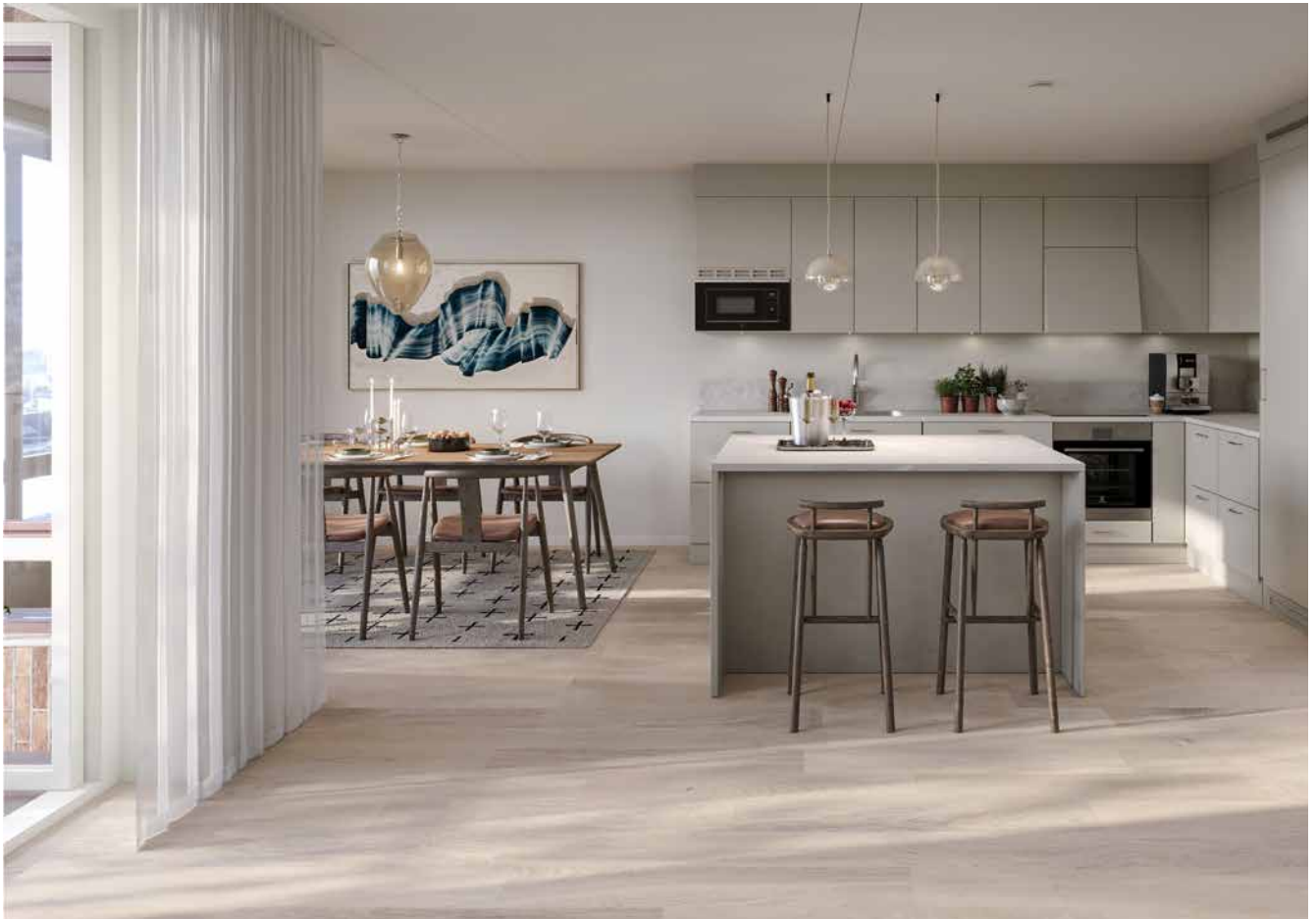
Köksö med stenkomposit som harmoniserar med rummets mjuka toner och material.