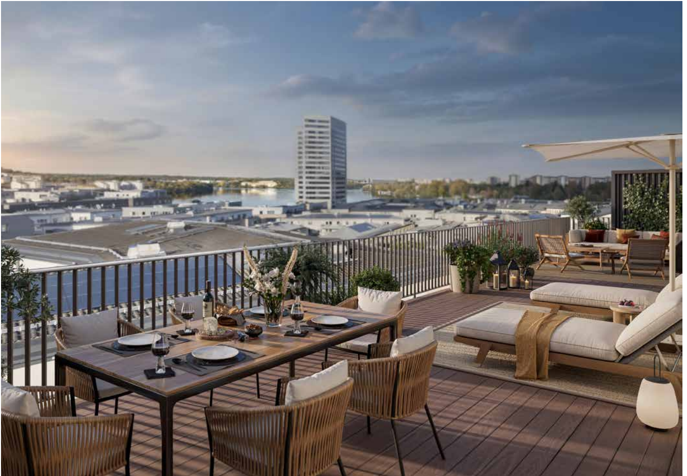
Takterrass för både sol och umgänge. De fyra översta våningarna bjuder på extra generösa terrasser varav den största är hela 66 kvm stor.