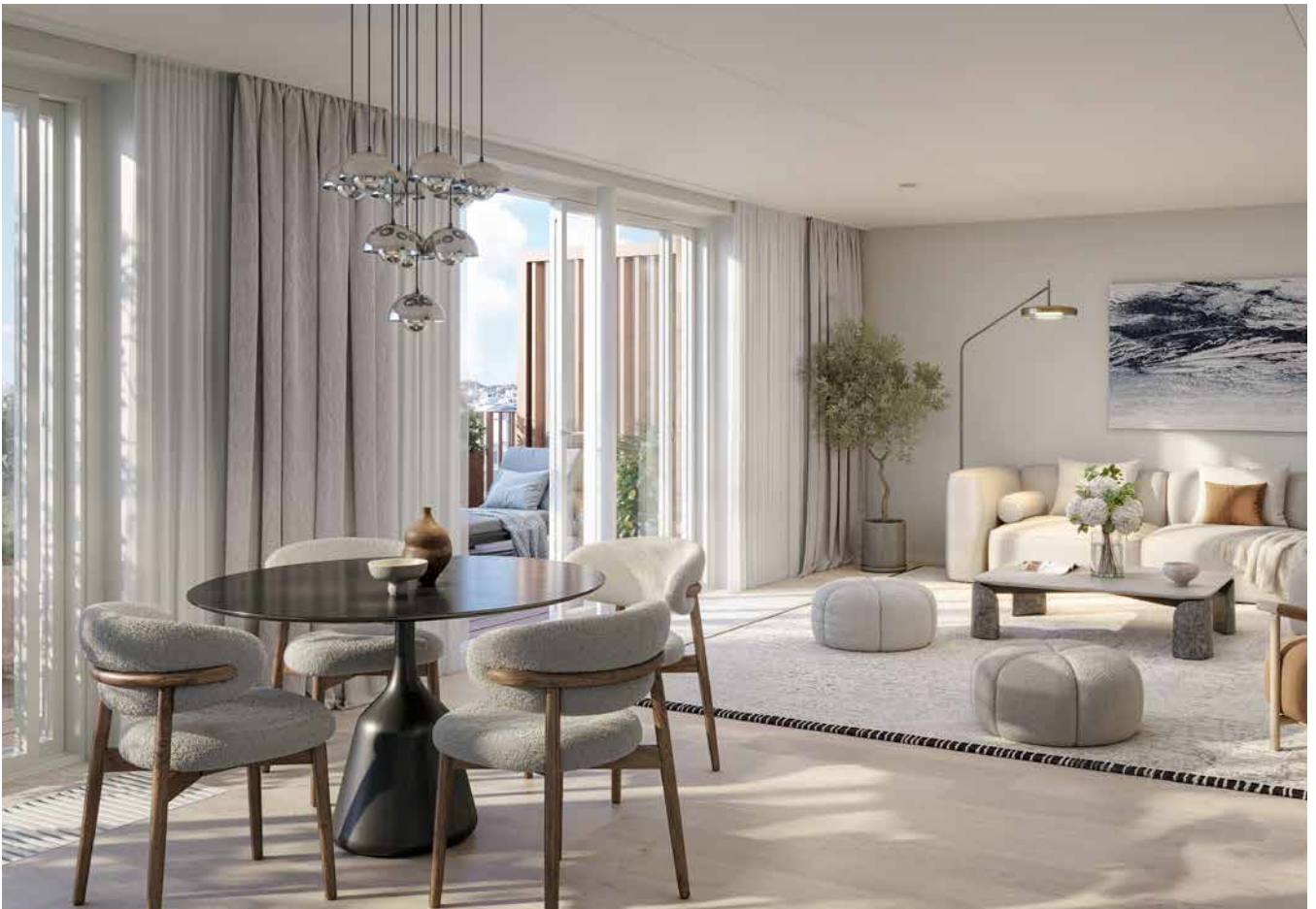
Öppna planlösningar, fina ljusinsläpp och generösa balkonger skapar hem för umgänge, året om.