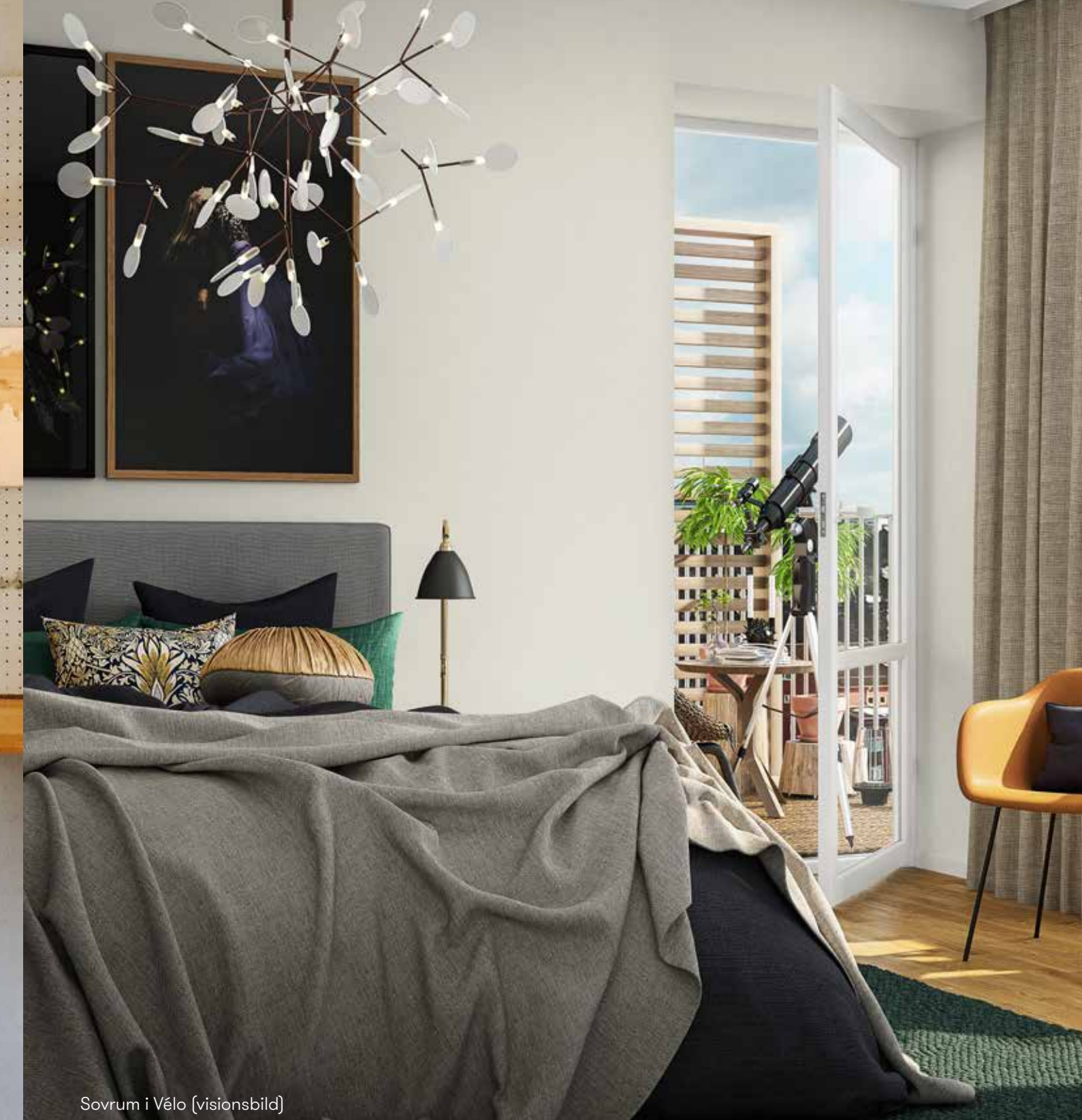
Sovrum i Vélo (visionsbild)